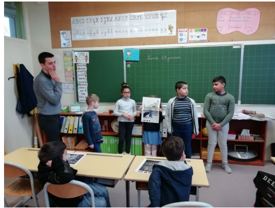
Jouons la carte de la fraternité