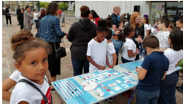
Tables citoyennes pour enfants, adolescents et adultes