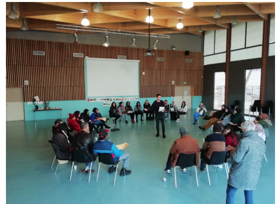
Café-parents dans un collège de Besançon