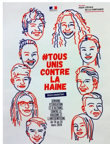
Semaine de lutte contre le racisme