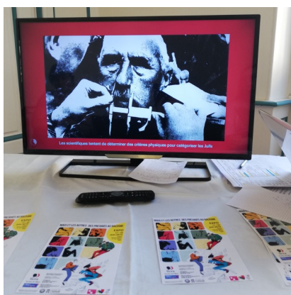
Exposition interactive « Nous et les autres »