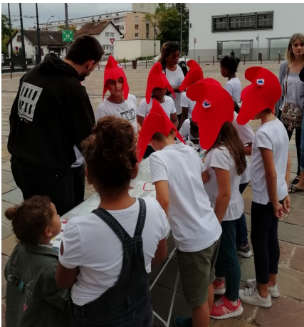
Fête de la République - stand enfants