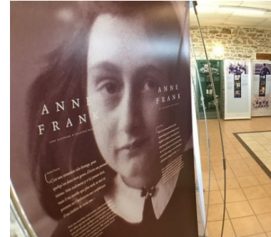
Exposition Anne Frank, une histoire d'aujourd'hui