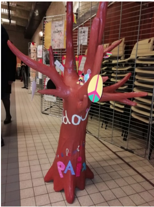
L'Arbre de Mémoire enfants de 7 à 9 ans

Nous co-construisons les événements avec nos partenaires : par exemple sur le genre, les stéréotypes, le racisme, l'interculturalité... et nous abordons ainsi, sous un angle pluridisciplinaire, les différentes facettes de l'être humain, afin de nous permettre de vivre dans une société ouverte et tolérante.