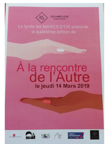
Journée au lycée Les Marcs d'Or