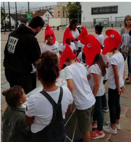
Fête de la République - stand enfants