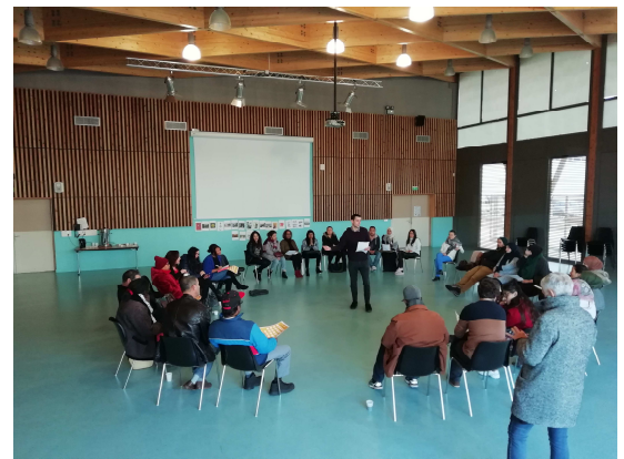
Café-parents dans un collège de Besançon