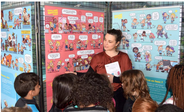
Exposition « Egalité parlons-en ! »