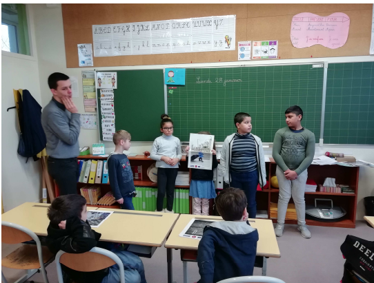
Jouons la carte de la fraternité

Chaque année, nous touchons plus de 10 000 enfants, jeunes, visiteurs par nos actions