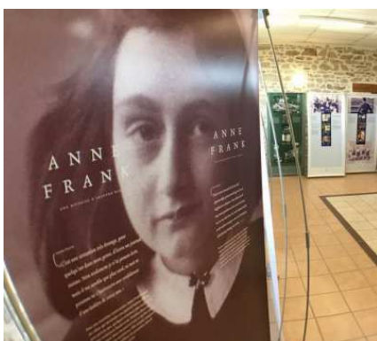
Exposition Anne Frank, une histoire d'aujourd'hui