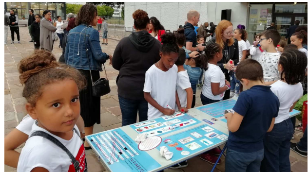
Tables citoyennes pour enfants, adolescents et adultes