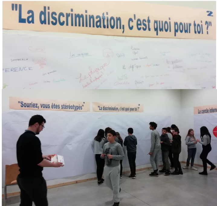
Collège Edouard Herriot Chenove