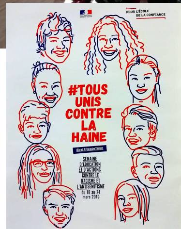
Semaine de lutte contre le racisme