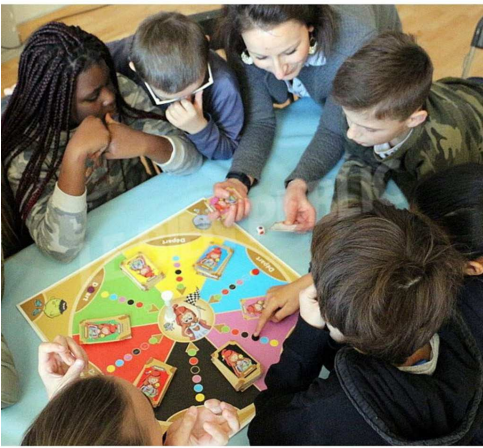
Jeux de société « Tous égaux, tous différents »