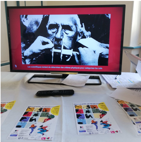
Exposition interactive « Nous et les autres »