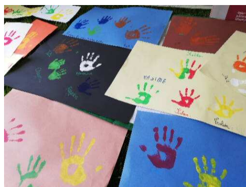
« Jouons de nos différences »