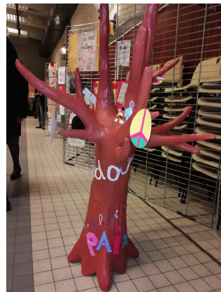
L'Arbre de Mémoire enfants de 7 à 9 ans